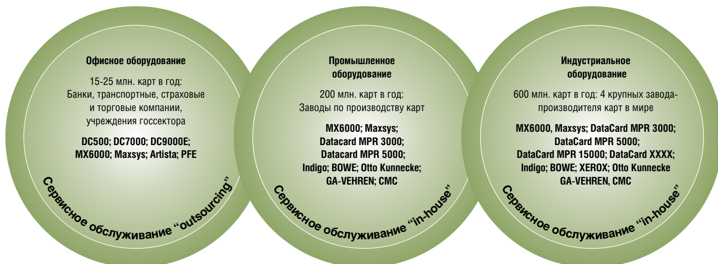
Классификация оборудования для массовой персонализации и подготовки к почтовой рассылке

В MX6000 по-прежнему доступны все традиционные модули: